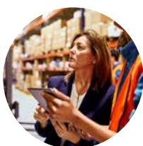
Ética e integridade

O presente “Código de Ética e de Conduta para Fornecedores, Terceirizados e Colaboradores do Grupo Ecnor” , que é uma extensão do Código de Ética e de Conduta do Grupo Ecnor (disponível no seu site corporativo, www.ecnor.com , para qualquer pessoa ou organização que se relacione com ele ou que tenha um interesse legítimo), constitui, portanto, uma ferramenta fundamental do Grupo Ecnor para fomentar que seus fornecedores, terceirizados e colaboradores realizem suas atividades segundo as melhores práticas empresariais e padrões éticos.